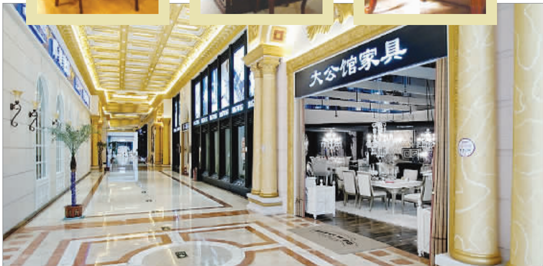
奢华的“凡尔赛宫”汇聚了很多欧美著名品牌家具

M 红星·美凯龙 MACALLINE 卡子门商场 精品建材、家具、灯饰、软装 12月4日起 华丽上演