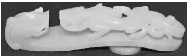
明代白玉蟠龙带钩