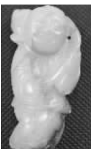
宋代白玉执荷童子