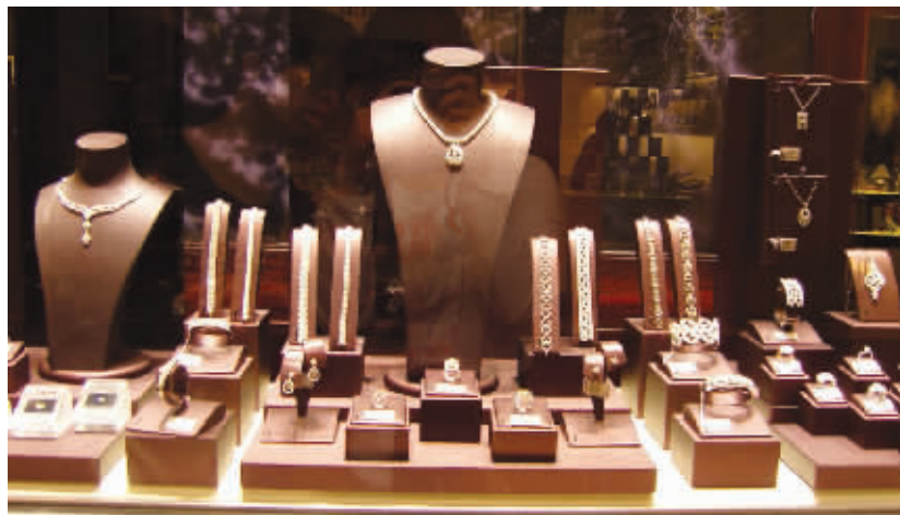
珠宝店是“粉红豹”觊觎的对象

扩至96版,售价8元 全年订阅价格192元 全国各地邮局均可订阅 订阅热线:010-63077013 63077014