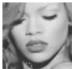
蕾哈娜 《Loud》 评分:★★★★☆

美国会弹一手好吉他的人很多,一副好嗓子兼才华出众的创作才子都很多,但自称“男巫”的就只有Jason Mraz一人。《Life Is Good》是他刚发布的一张Live EP,jason mraz用一半时间跟歌迷在音乐中摇摆,当然也少不了对歌曲的即兴变换。