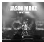
Jason Mraz 《Life Is Good》 评分:★★★★☆

美国会弹一手好吉他的人很多,一副好嗓子兼才华出众的创作才子都很多,但自称“男巫”的就只有Jason Mraz一人。《Life Is Good》是他刚发布的一张Live EP,jason mraz用一半时间跟歌迷在音乐中摇摆,当然也少不了对歌曲的即兴变换。