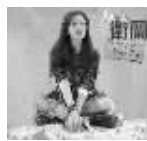
卫兰 《Love Diaries》 评分:★★★★☆

《Loud》无疑是蕾哈娜曲风最多元的一张专辑,在专辑里你可以听到Pop、R&B、Hiphop、Dance和Regge的融合。第一单曲Only Girl强劲的欧陆舞曲节奏让我们不禁大呼:那个快乐的RIHANNA终于回来了!同时,RIHANNA独特的声线再次被发挥到了极致。