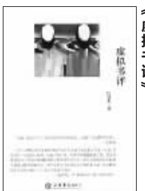
2010年8月 上海书店出版社 比目鱼著 《虚拟书评》