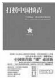
2010年11月 北方文艺出版社 廖保平著 《打捞中国愤青》

被称作“中国反愤斗士”的廖保平的新作《打捞中国愤青——“中国崛起”潜在的阻碍和危险》问世了。这本书的中心词汇还是愤青,中国特色的愤青,他的“老冤家”。