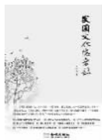
2010年11月 金城出版社 方韶毅著 《民国文化隐者录》

本书选择了二十多个现代文化人,纳之于风云变幻、时代转型的社会大背景下来进行观察,通过讲述他们的传奇故事,于小处了解民国知识分子心路历程,同时也展现了一幅幅文化人的生活图景。