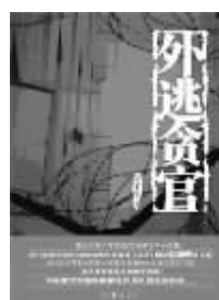
2010年11月 作家出版社 刘千生著 《外逃贪官》

本书选择了二十多个现代文化人,纳之于风云变幻、时代转型的社会大背景下来进行观察,通过讲述他们的传奇故事,于小处了解民国知识分子心路历程,同时也展现了一幅幅文化人的生活图景。