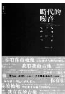
张铁志著 《时代的噪音》 广西师范大学出版社 2010年10月

早在2004年,张铁志就在台湾出版了第一本著作《声音与愤怒》,这本书“颠覆”了人们对于音乐评论的刻板印象——它将目光瞄准了音乐与社会运动的关系。时隔六年,张铁志带着他的第二本音乐评论作品《时代的噪音》又出现在人们面前。在张铁志看来,时代在变,但“摇滚乐中反抗的力量从来没有削弱过”。《时代的噪音》深入检视了20世纪至今西方重要的“抗议歌手”群英谱,探索来自民间的“抵抗之声”与他们所处时代的关系,讨论音乐到底如何能产生推动社会进步的力量。除此之外,本书还从侧面刻画了不同历史阶段的“社会反抗史”:从20世纪初