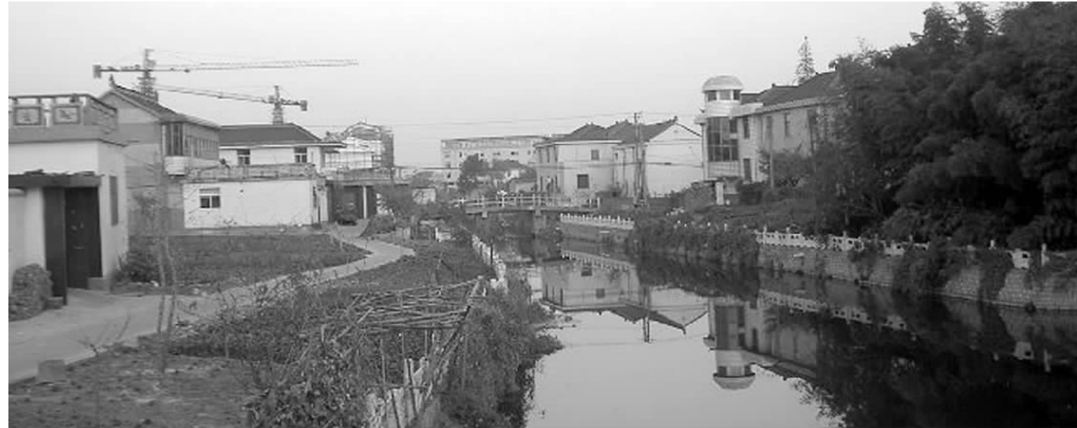
今年11月7日的村委会选举在东唐村引起很大争议

由于事先没有联系上发帖人,快报记者只身进入村里走访。在东唐村九组,快报记者向一位