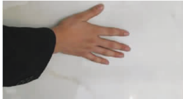
测试瓷砖平整度,自己就可动手