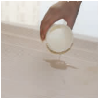
一杯水就能试出瓷砖吸水率