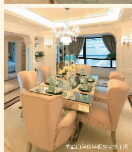
紫晶山国际样板房实景展示