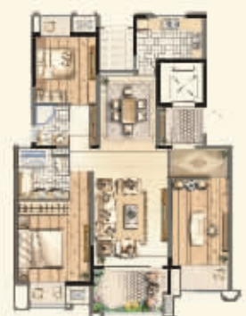
约140平米雅座三房 王牌再现