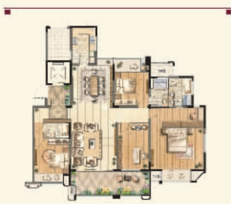
约200平米皇家府邸 香阔至上

东贵——城东紫金山、西富——河西CBD历来为金陵两大传统高端居住区，承载着金陵文脉的尊重，根植于自身品牌，保利地产东西并举，以人文的厚意来诠释紫金山的奢华与荣耀，用艺术的华美演绎河西CBD的繁华与优雅，充分展现人文地产、艺术筑城的强劲实力与精湛魅力，为楼市调整期中的品质置业梦想，提供了完美的选择。