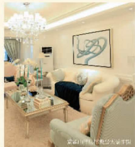
紫晶山国际尊贵大堂样板间