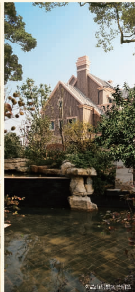
紫晶山国际实景示范区