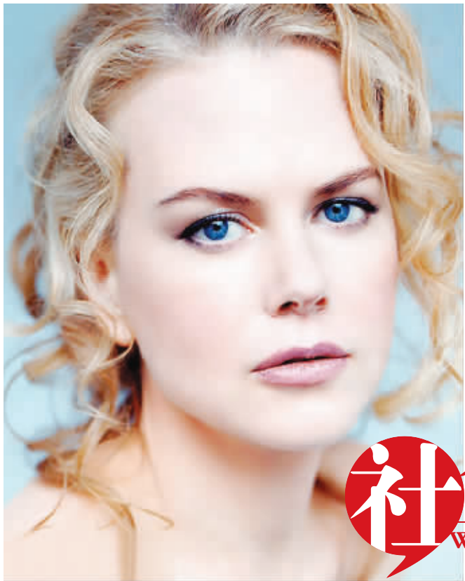
金发美女妮可·基德曼

他的罪行比两年前轰动一时的奥地利“兽父”约瑟夫·弗莱茨勒更为严重,弗莱茨勒曾在自家地下室囚禁并强奸亲生女儿长达24年,与其育有7个孩子。不同的是,阿根廷的法律不及奥地利的法律严苛,弗莱茨勒已于2009年被判处终生监禁,但阿根廷“兽父”最高仅面临20年的刑期。 综合