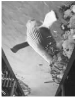
平时的世贸天阶天幕

昨天下午,《新周刊》在自己的微博上发布了这样一条消息:“2010年11月21日20点40分,一名男子来到北京世贸天阶‘天幕’下,打开笔记本电脑接上无线网络,躺在躺椅上玩网络游戏……据了解,该男子是某著名网络游戏公会的会长,耗资10万元包下这块巨幕玩游戏。”