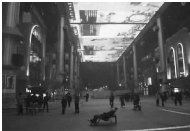
玩家在世贸天阶巨幕下玩网游

玩家为了游戏,到底会疯狂到什么程度?有网友爆料称,11月21日20点40分,一名男子驾车来到世贸天阶全亚洲最大的LED大屏幕下,打开笔记本电脑接上无线网络后,躺在事先准备好的一张躺椅上玩起了网络游戏。据悉,这块大屏幕的租金不菲,10分钟时间需要近10万元人民币。 □快报记者 张润芝综合报道