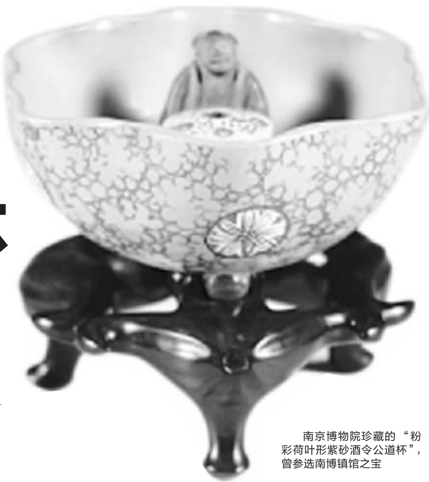
南京博物院珍藏的“粉彩荷叶形紫砂酒令公道杯”,曾参选南博镇院之宝