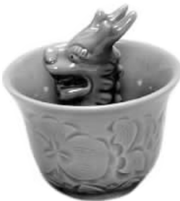
如今景德镇复制的公道杯工艺品

心直立的短柱,外底部有漏孔,巧妙运用虹吸原理制造。这正是物理学中流体力学的原理。”杨海涛称,具体地说,酒液从较高处通过一条拱起弯管,先向上再向下流到较低之处,其因为弯管要呈倒U字形且一端较长,使用时管内必须先充满液体。公道杯里外的两孔之间由弯管相连,外部一端较短内端长,而筒形短柱所标小圆突的位置即弯管最上端的部分。当杯中水低于或平齐于小圆突点时,水不会漫过弯管而泄流,当水超过小圆突时,水面高出弯管产生压力,于是通过虹吸而使水顺右弯管流到杯外直至流净。其实,我们日常生活中也常常利用这个虹吸现象,比如驾驶员就采用虹吸管从油桶中吸出汽油。公道杯之所以公道,杯中之水能漏完的奥秘也就在龙头上面。