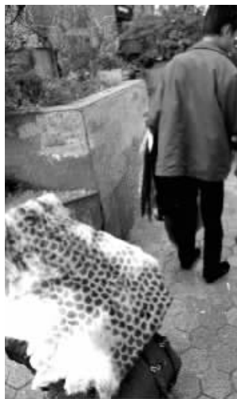
小贩街头兜售“豹皮”