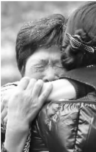
火灾居民安置点悲伤的家属