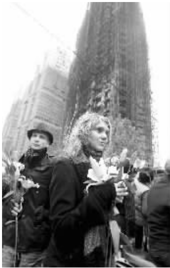
昨天,两位俄罗斯留学生在现场悼念遇难者

起火建筑位于上海市胶州路728弄1号。大楼底层为商铺,2至28层为住宅,其中有5家单位、156户居民,实有人口440余人。火灾发生时,该建筑正在实施静安区政府实事工程建筑节能综合改造项目,总包方为静安区建设总公司,分包方为上海佳艺装饰公司。同小区另外两栋大楼是静安区为了解决该区教师住房困难而建设的,当地居民俗称“教师公寓”。而起火的728号大楼是商品房,对社会公开出售,并非“教师公寓”。