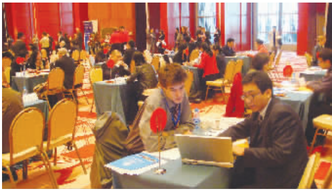
“游中国”洽谈会现场火爆。

旅游机构来说都非常新鲜,所有的国内“卖家”带着自家旅游产品坐在国外“买家”面前进行推荐,如同面试一般。开场后两个小时,云南商务国旅公司总经理严东笑呵呵地来到了休息区等候下一场洽谈。“上午已经谈了5场,大约3个买家对我们的产品产生兴趣,我们已经交换了联系方式,接下来我们会单独进行对接将这些达成合作意向的项目落