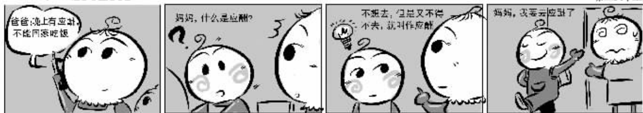
登录 http://b1207585.xici.net 提供图片素材 绘图:余晓峰