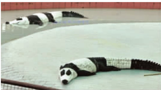
当鳄鱼已经满足不了它们了