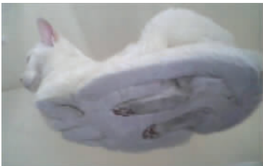
换个角度,世界更精彩