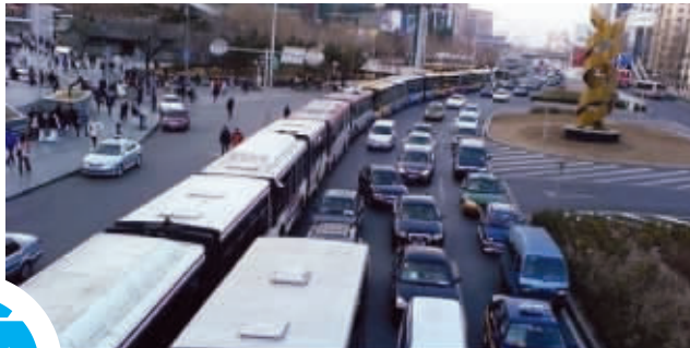
天哪,中关村通火车了吗?