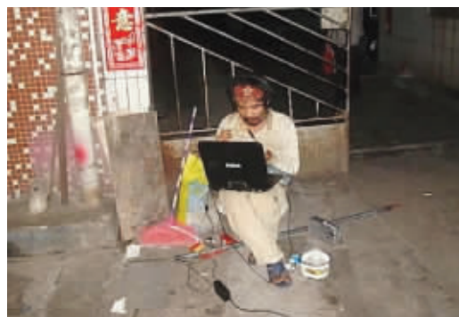
老板们行行好,这是我的网银账号