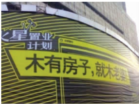
悲惨现实主义广告的代表作