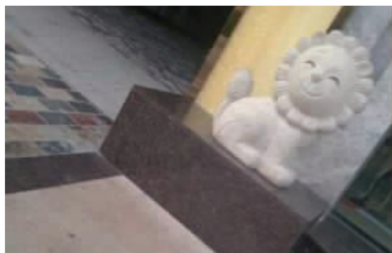
这家银行门口的雄狮让我震惊了