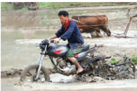
最新改装耕田车,后面的牛傻眼了