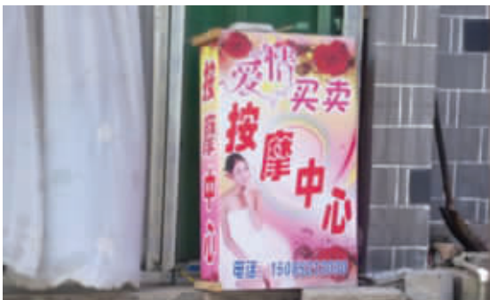
神曲居然沦落到如此地步