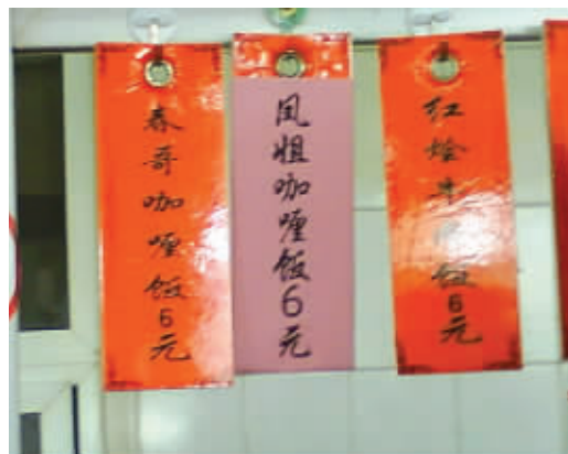
学校食堂推出了重口味咖喱饭