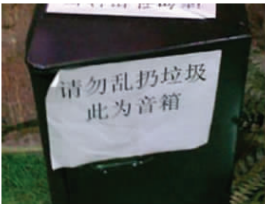
长得像包子,别怨狗跟着