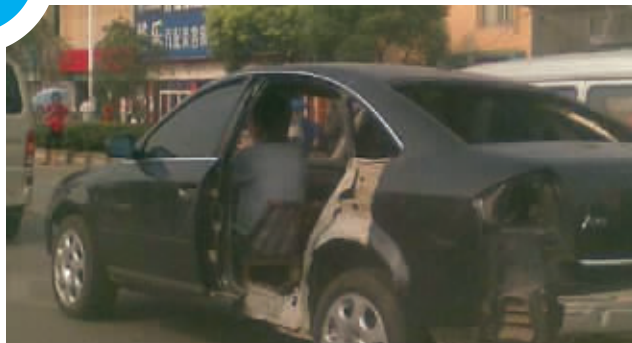
华丽的外表,低调的内心