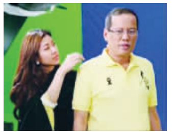
阿基诺三世与28岁的黄莉兹

11日,菲律宾媒体更是惊爆猛料:阿基诺三世与黄莉兹日前已“闪电订婚”,并准备在明年10月