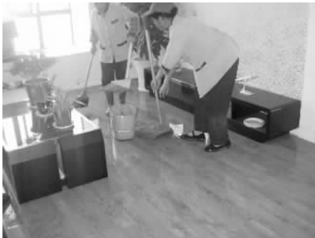
刚装修的新房竟被粪水浸泡,物业组织人员清扫粪水。

到,事发是因为9楼住户天花板漏水,才通知10楼住户的,而且清理也很及时,调集了大批人员前来。