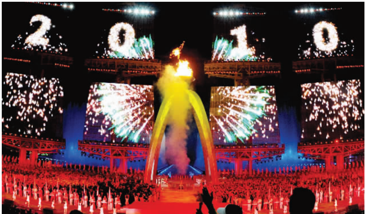
烟花齐放,主火炬台光彩夺目