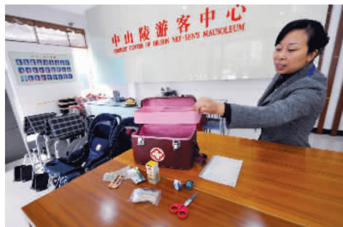
昨日,中山陵游客中心为免费开放做准备