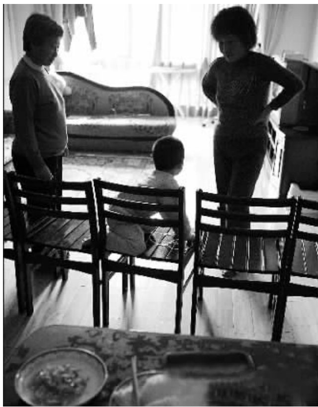
毕竟人无完人,如果觉得自己的选择不称心,最好的方法是多花时间与其沟通,耐心“调教” (资料图片)