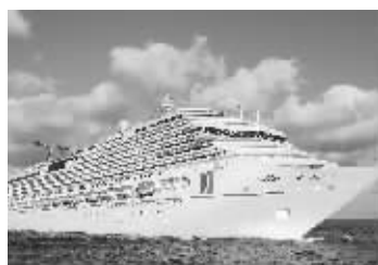
“光辉嘉年华”号游轮

新华社专电 一艘大型游轮8日因轮机舱起火在墨西哥西部海域搁浅,近4500名乘员受困。