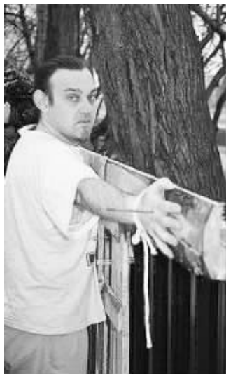
奥雷格曾将自己钉在十字架上,并因此受到俄罗斯法庭的指控

据报道,现年45岁的奥雷格·马夫罗马蒂是一名富有争议的俄罗斯行为表演艺术家和电影制片人,2000年,他以“艺术的名义”将自己钉在一副十字架上,并请人将这一荒诞的行为艺术拍成了视频,这一视频后来还被传上