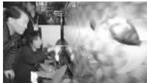
处理后的循环水中养金鱼

为确保峰会的安全, 韩国警方已在韩国国际会展中心(COEX)周围搭建了两道2米多高的临时防护墙。此外, 在会场内供各国政要使用的卫生间里, 还将出现金鱼“质检员”。这些金鱼被饲养在经循环处理过的水中, 一方面宣传了峰会绿色环保的理念, 另一方面也为了确保水中没有人投毒。