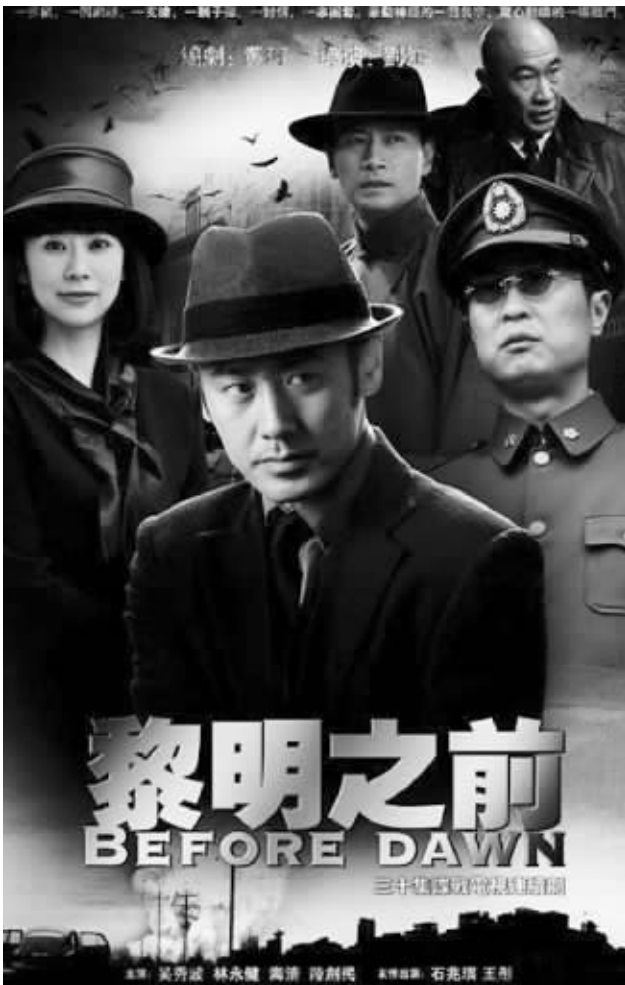
相比较美剧,国产剧是长期占据视频网站收视榜单的“多数派”

2010-2011美剧秋季档自9月中旬开播以来,《行尸走肉》《海滨帝国》《天堂执法者》等剧吸引了很多国内网友的关注。网上看美剧,似乎也成了很多剧迷的首选。不过,正当大家以为美剧在国内是网上收看率最高的剧种时,记者近日通过对各大视频网站的调查后却意外发现,虽然美剧比较受推崇,但真正的点击量却很少,长期占据视频网站收视榜单的“多数派”恰恰是“原汁原味”的国产剧。