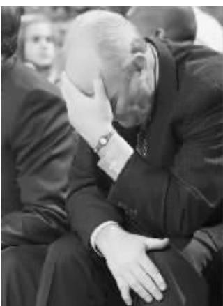
步行者手感太好,掘金主教练卡尔目不忍视

半场比赛结束的时候,掘金队落后的分数还只有10分,谁也没想到这场比赛会提前失去悬念。可比赛到了第三节,势头却完全转向了步行者这一边。格兰杰和希伯特连续在外线投篮命中,迈克·邓利维也在外线找到了三分的手感,加上科里森的突破将掘金的防守完全击破,步行者很快呈现出了全面开花的局面。步行者出色的投篮手感此时就像传染病一样蔓延开来,一个、两个、三个,步行者弹无虚发,几乎整个球馆都开始沸腾了,伴随着连续的进球,球迷们的欢呼声一浪高过一浪。直到本节行将结束,步行者前锋麦克罗伯茨的最后一次投篮偏筐而出。在此之前,步行者在