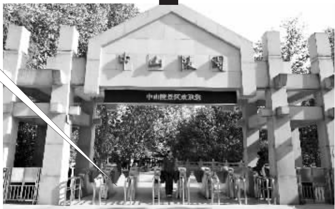
中间的显示屏将显示进园游客量