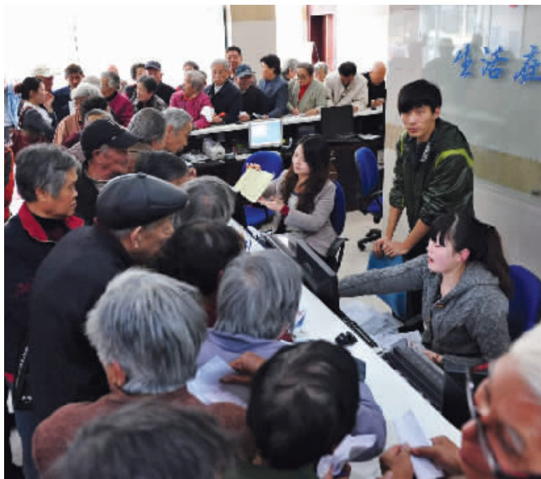
办卡的市民排起长队

“我中午就到应天大街19号办理不带社保功能的市民卡,可工作人员一个下午只办理100个人,我排了大半天队也没挤上,只能明天再来了。”昨天下午3点多,市民陆先生向快报热线96060反映,目前有很多人排队办理不带社保功能的市民卡,有的老年人排队好几个小时,最后还没办成,“办卡为我们提供方便,这是好事,可是有关部门在操作上是应该更人性化一点?”