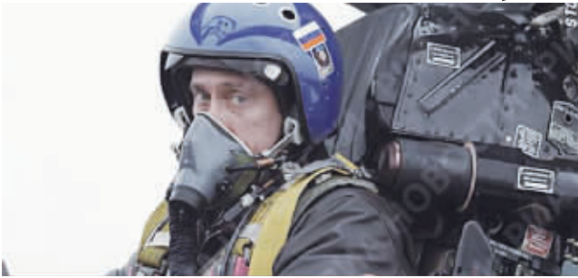
●2000年3月1日,普京在苏-27截击歼击机驾驶舱内