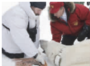
●2010年4月29日,普京参观了位于北冰洋的俄法兰士约瑟夫地群岛,并参与了俄罗斯谢维尔佐夫生态与进化问题研究所组织的针对北极熊的科考活动。普京当天还为一只被捕获的北极熊戴上了卫星跟踪项圈