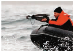
●2010年8月25日,普京在一艘橡皮艇上持弩瞄准鲸鱼。普京当天随科考队来到奥尔加湾,并亲自持弩射鲸,以取下一小块鲸鱼皮用于科学研究