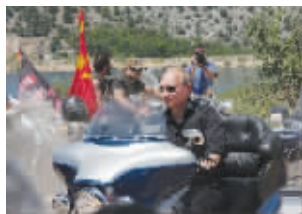
●2010年7月24日,在乌克兰塞瓦斯托波尔,普京驾驶一辆哈雷摩托车前往一个俄乌摩托车爱好者的聚会营地参加活动