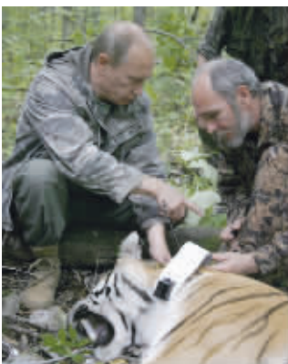
●2008年8月31日,在俄罗斯远东地区,普京在科学家的帮助下为一只5岁的老虎戴上项圈