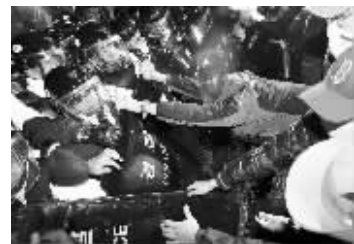
示威者与防暴警察发生冲突

韩国首都首尔11月7日爆发大规模游行示威，抗议定于本月11日至12日在韩国举行的二十国集团（G20）峰会，示威者一度与防暴警察发生激烈冲突。