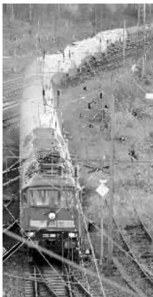
核废料运载列车驶入德国哈灵根路段 新华社/法新