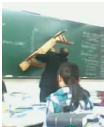
这位老师肯定是散落民间的高手