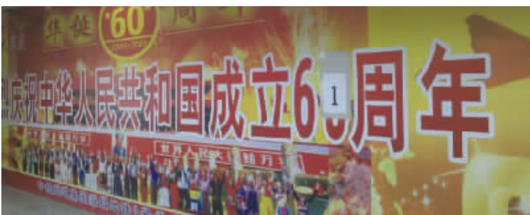
建设节约型社会,由此可见一斑