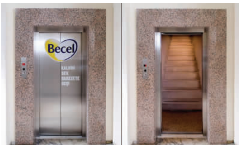
2010年最新款节能环保电梯