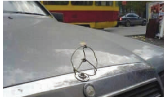
样子是颓废了点,但是意思还在