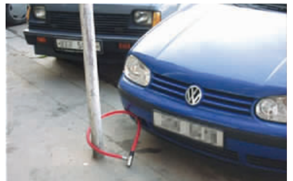
好车配好锁,好马配好鞍