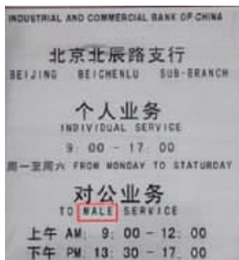
男女平等了,再开个对“母”服务吧