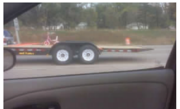
从这架势看,此车一定非同一般