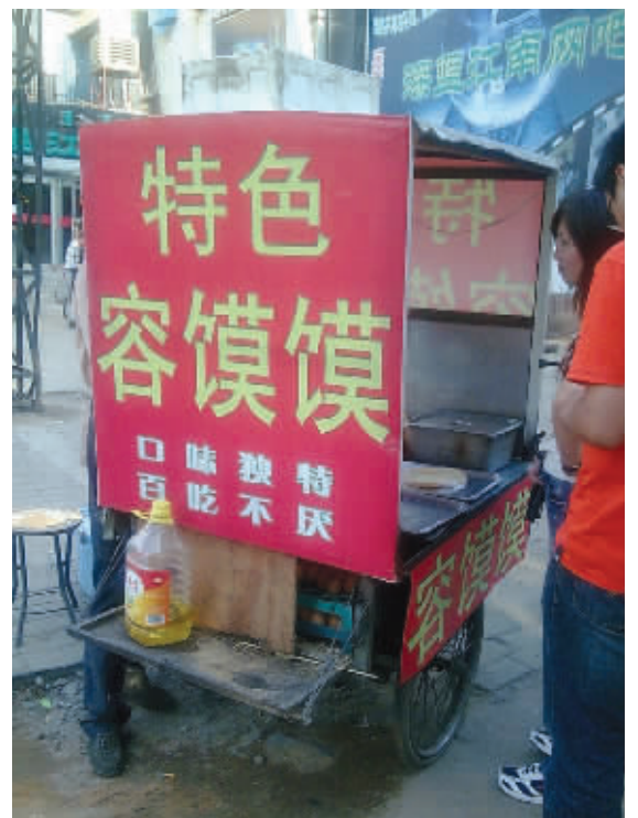
真不敢买,怕“馍里藏针”