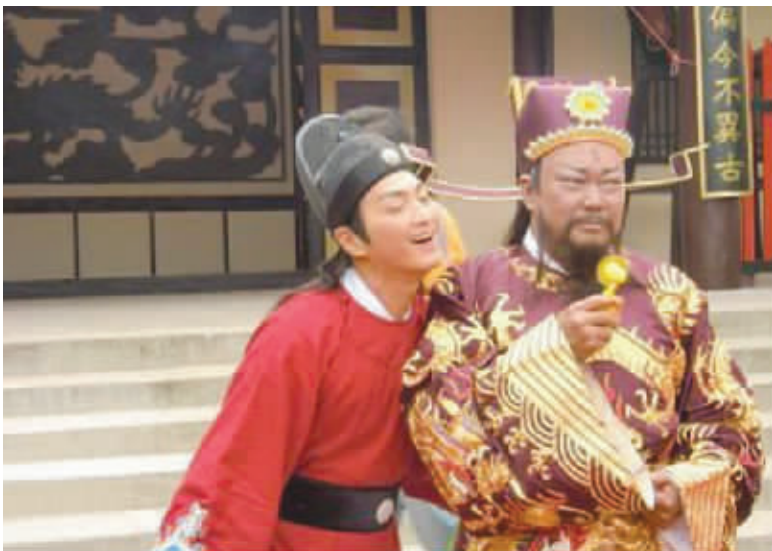
御猫最讨厌了,老蹭本府的小电扇