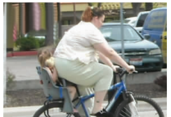
妈妈不减肥,孩子真受罪