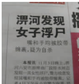
福尔摩斯、波洛、柯南均泪流满面