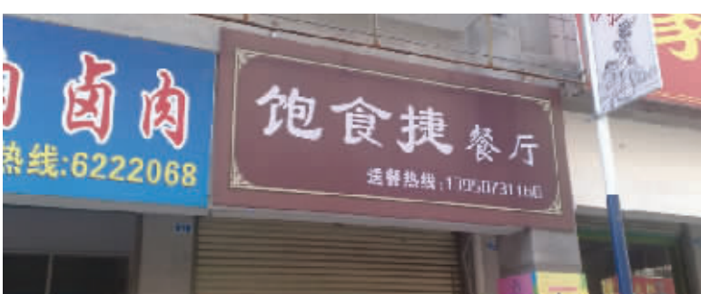
在这家饭店吃饭,速度一定要快