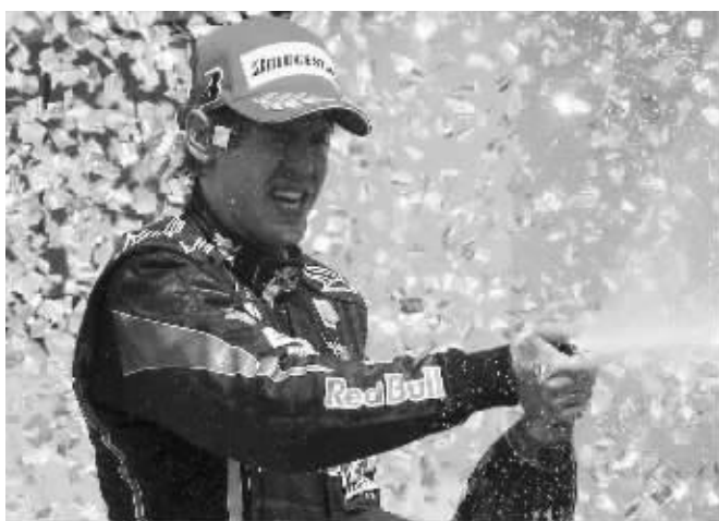
维特尔夺冠后庆祝

当然,正所谓“鹬蚌相争,渔人得利”,由于红牛车队坚持不使用车队指令,法拉利车手阿隆索正在无限逼近个人职业生涯的第三个车手总冠军,只要西班牙人能在阿布扎比夺取亚军,红牛期待的另一个神话将成为笑话。