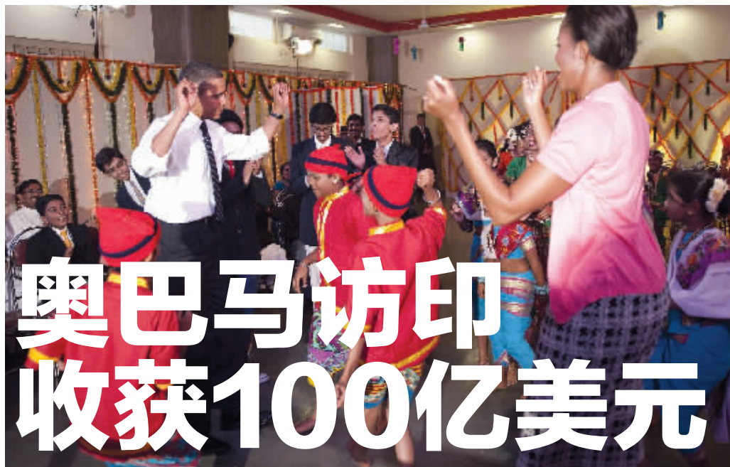
奥巴马与夫人在印度一所中学,与学生一同跳舞,庆祝印度传统排灯节