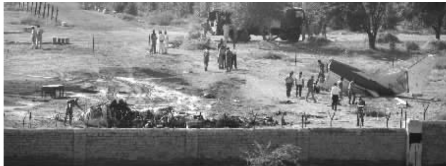
军人和救援人员在飞机失事地点搜救

JS Air公司发言人哈尼夫则表示,飞机坠毁的原因还有待进一步查实,目前下结论“为时尚早”。 中国日报