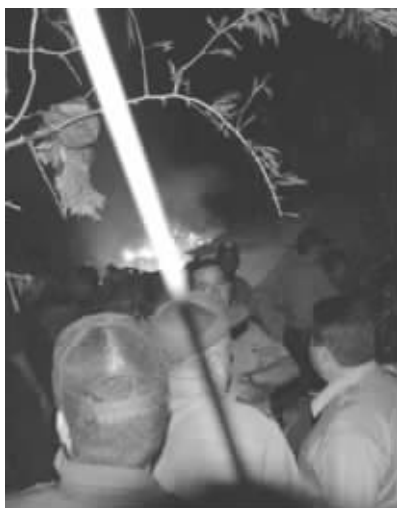
救援人员和当地居民在客机失事现场查看飞机残骸

坠机发生后,圣斯皮里图斯全市的医生都被紧急动员起来,但从现场发回的消息令人感到沮丧,因为没有人幸存。当地一家医院的雇员透露:“我们等了半天也没看到有人被送进医院,我们听到消息说没人活下来。”