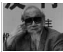
【故宫帝后玉玺】文化总顾问：国学大师、书法家、文学家陈怀先生