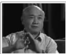
【故宫帝后玉玺】总设计师：故宫博物院原副院长杨兴先生

玉价格的升值压力，收藏者对和田玉【世博双玺】的涨价预期高涨，【世博双玺】发行配额严重紧张，预计世博双玺将进入“白热化”阶段。预计本轮上浮在1000元左右，在此提醒已收藏世博双玺的收藏者在转手时注意关注。