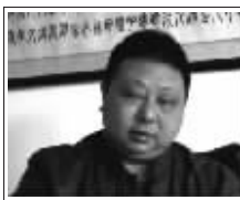
【故宫帝后玉玺】玉雕大师：中国玉雕大师、工艺美术大师张瑜先生