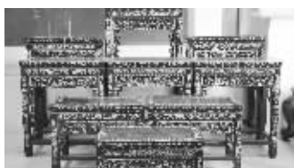
清中期的“九几连珠”

花梨有“海黄”和“越黄”之分。“海黄”在木材本身的颜色、纹理和气味上都要优于“越黄”。市场上大部分黄花梨家具基本上都是“越黄”。黄花梨的纹路如行云流水般充满一种自然之美,它的独特之处就在于那充满神秘色彩的“鬼脸”花纹。每一处“鬼脸”都浓墨淡彩,无一雷同。