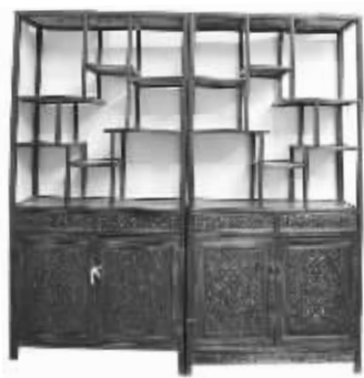
海南黄花梨百宝柜

近年来,古典家具成为了艺术品拍卖市场上的一朵奇葩。2009年香港苏富比秋拍会上,一件“清乾隆御制紫檀木雕八宝云纹水波云龙宝座”以8578万港元的拍卖价格创下中国家具世界拍卖纪录。提起古典家具,人们往往会想起海南黄花梨、小叶紫檀、大红酸枝、红檀、鸡翅等俗称红木的名贵木材。近日,记者在朝天宫古玩市场里见到了不少珍贵木料制作的古典明清家具。