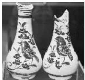
宋代吉州窑对瓶标本