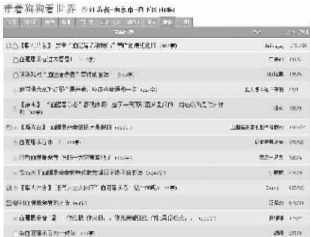
昨天,西祠上出现大量讨伐“屠夫”的帖子(网络截图)