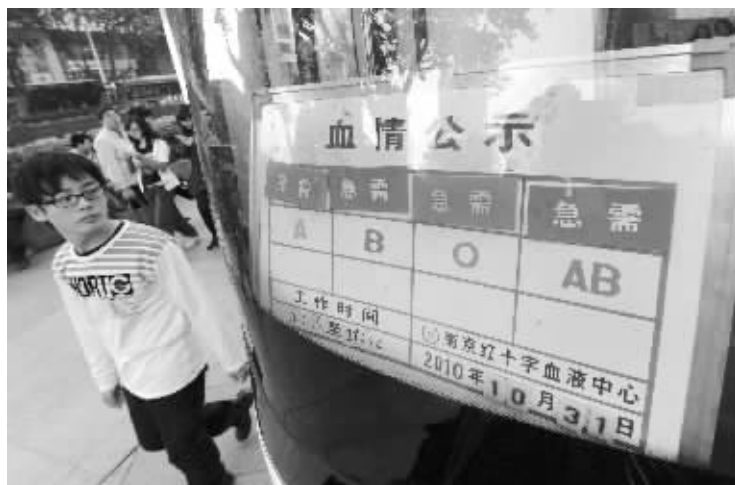
献血车车窗上,一块“血情公示牌”引起路人的关注