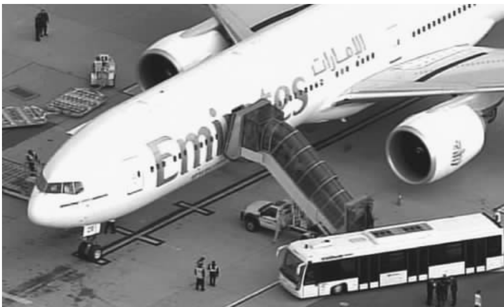
10月29日,安全人员在美国纽约肯尼迪机场检查一架装有发也门货物的飞机

英国和阿拉伯联合酋长国29日截获两个可疑邮包。邮件发自也门,目的地为美国,调查人员在邮包中发现爆炸物。