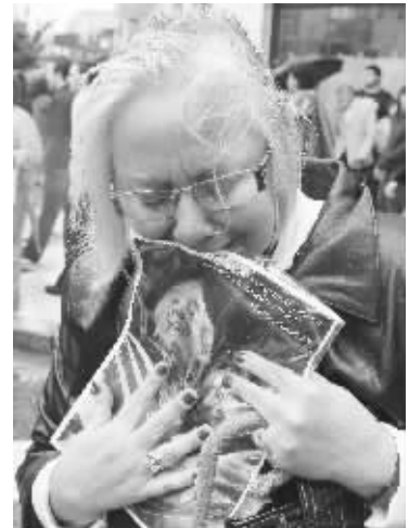
10月29日,一名老人哀悼前总统基什内尔