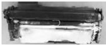
被人做过手脚的硒鼓