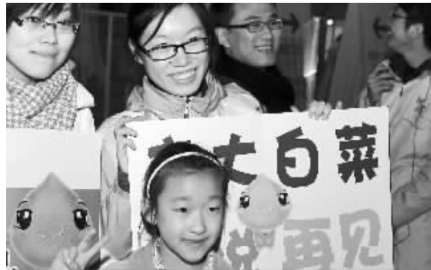
游客和志愿者说再见 新华社图