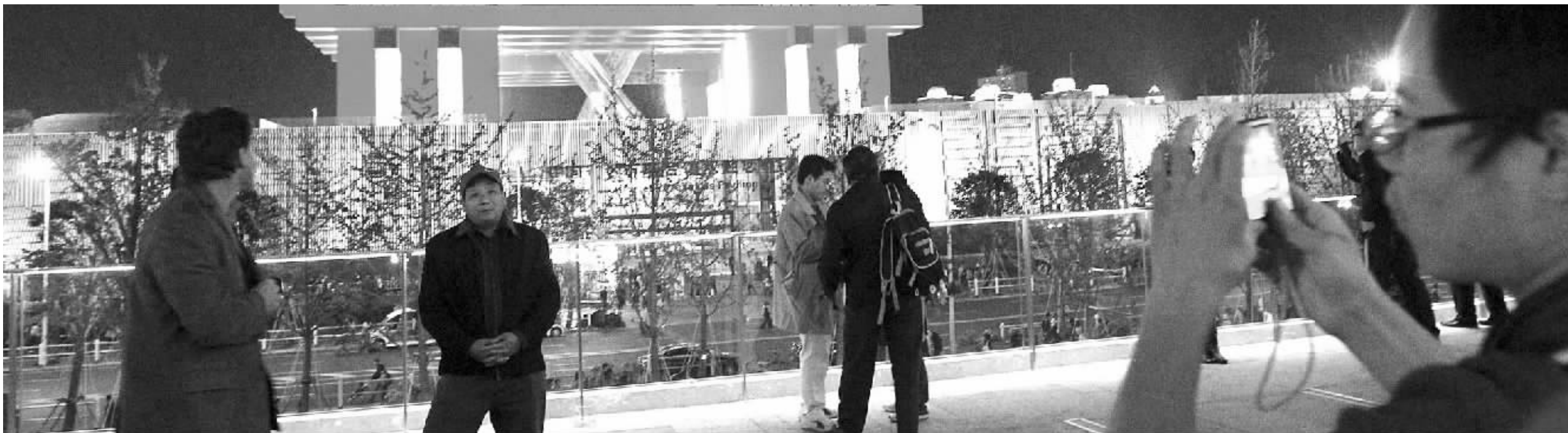
昨日,搭上了世博末班车的游客在中国馆前合影

2010年5月1日-10月31日,上海世博会陪伴我们走过了一百八十几个日日夜夜。今天,上海世博会将举行闭幕式,我们就要和世博说再见。