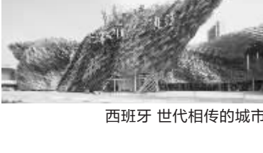
西班牙 世代相传的城市