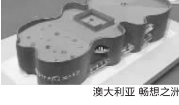
澳大利亚 畅想之洲