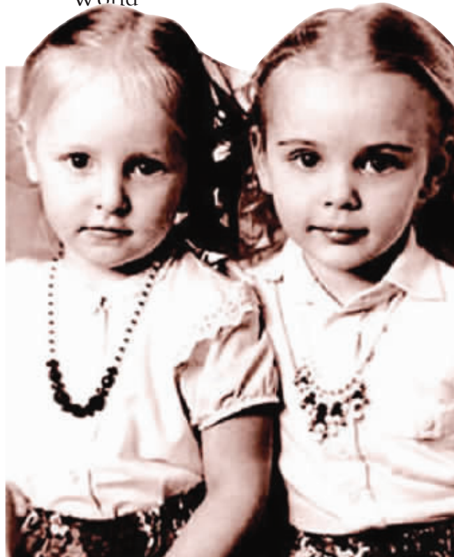
普京两个宝贝女儿童年合影

据了解,当普京听说小女儿年纪轻轻就打算结婚时,起先还多少有些反对,但在同尹某见面之后很快便喜欢上了这位老实低调的东方小伙子。曾于2007年在莫斯科工作的韩国驻俄罗斯大使馆相关人士表示:“当时两人的