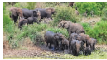
象群围住水塘。设计台词:鳄鱼,让你欺负我家小象!