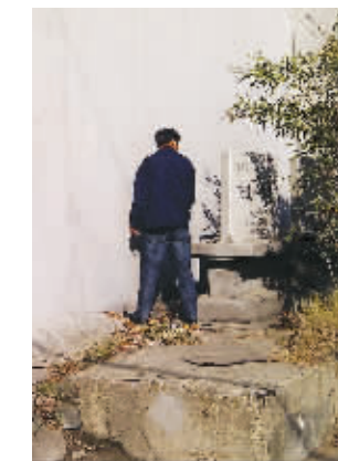
文保单位碑成了便溺处

据了解，由于此前住在这里的陆氏后人老去的老去，搬离的搬离，席老先生的老伴也曾屡次上书各级政府，希望政府能够重视陆定一故居的修缮工作。