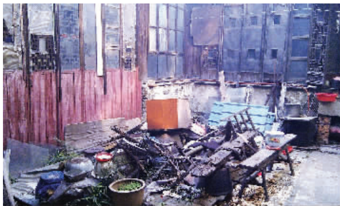
随意堆放的杂物让人很难相信陆定一故居是省级文保单位