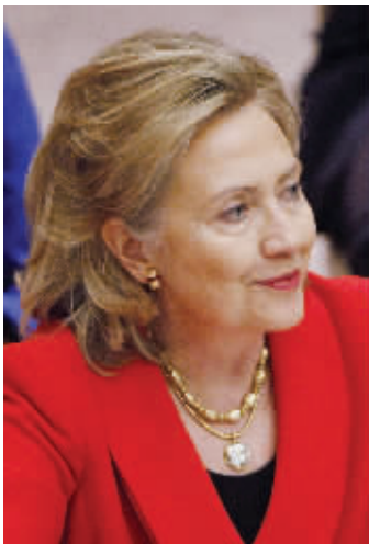
希拉里26日迎来63岁生日

希拉里上一次大过生日在2007年。她当时借60岁生日举办筹款会,喜剧演员比利·克里斯特和“壁花”摇滚乐队等演艺明星纷纷到场助阵,为希拉里筹得超过150万美元竞选资金。