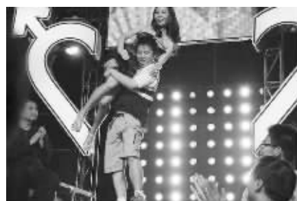
《老公看你的》节目现场

节目,《老公看你的》甚至不排除策划老年夫妻的专场,而且我们会在游戏环节做一些特别的设计,让它更适合老年人来挑战。”