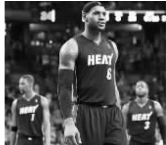
输球后热火三巨头一脸失意

响起了球迷的奚落口号,不过输了球的热火三巨头却显得很放松,“这只是82场比赛中的一场,下一场再见吧。”