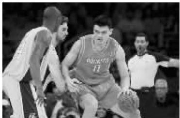
姚明挑拨科比加索尔