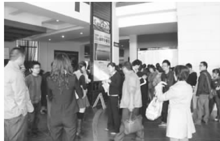
百家湖小公馆因其商业产权性质和5.9米挑高设计,引来投资客热捧

日前,楼市再掀风暴,调控政策密集出台,新的限制性政策随时可能到来。住宅市场再次陷入深度观望氛围之中。与此相反,不受政策影响、宜商宜居宜投资的挑高办公产品的投资热度出现大涨。