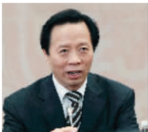
文化部副部长王文章

文化部副部长王文章说,目前我国已经基本完成了第一次全国普查,初步查明非遗家底有87万项,并建立了国家级、省级、市级、区县级的四级保护体系。“而且中国的非遗保护领域已从民间文学、传统音乐、舞蹈、戏曲、美术等民族民间艺术,拓展到了传统体育、游艺与杂技、传统技艺、传统医药、民俗等十大门类。”