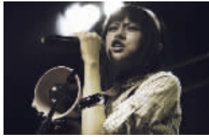
简迷离的成员之一