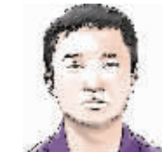
现代快报记者 葛九明