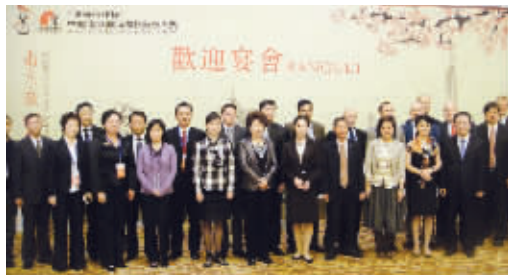
威尼斯酒店成为2010中国(国际)象棋大赛嘉宾下榻指定酒店

10月17日至21日,2010中国(国际)象棋超级大赛在南京举办。来自挪威、保加利亚、法国、印度、阿塞拜疆、中国六大国家的国际象棋选手集结于此。位于苏宁威尼斯水城的按五星级标准建造的苏宁威尼斯酒店,成为嘉宾下榻指定酒店。