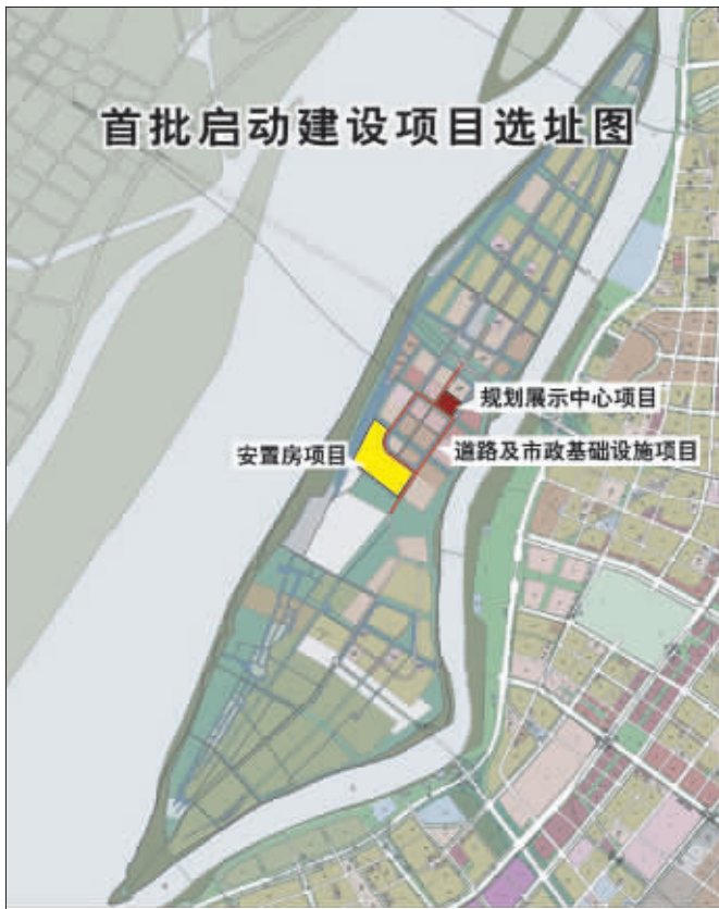
江心洲生态科技岛“首批启动建设项目选址图”

生态岛发展有一条重要愿景:建立一个全新的生活方式典范,人们的生活方式将发生革命性变化,绿色交通、垃圾分类、垃圾处理及利用、再生能源利用、非传统水源利用等将改变居民的传统生活模式。