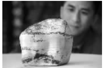
高先生收藏的奇石